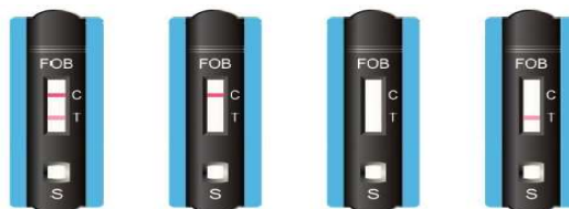
Pozitivní negativní nehodnotitelné

Soupravu FOB můžete skladovat mezi 4-30°C. Odebraný vzorek může být uložen v odběrové zkumavce za pokojové teploty až 14 dní ( při 4-8°C až měsíc). Expirace soupravy je až 15 měsíců. Pozitivní, či negativní výsledek, včetně ověření správného provedení testu se odečítá z testovací kazety na základě vzniku barevných linií v určených polích.